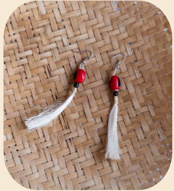
Aretes de fibra de pita y chuko