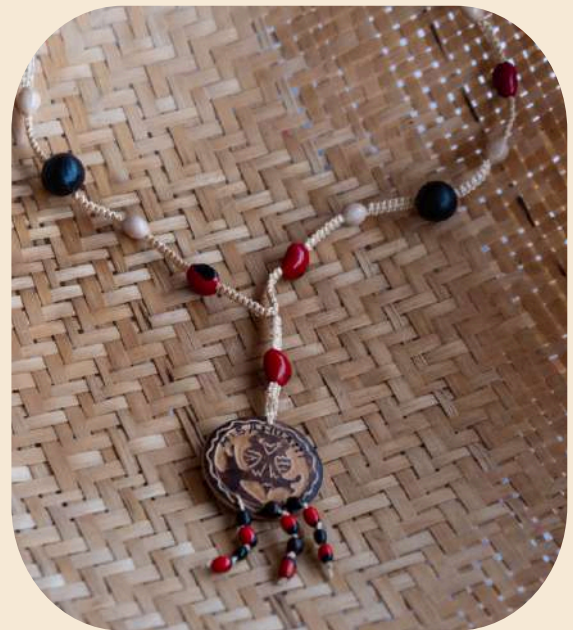
Collar con medalla de mate tallado a mano