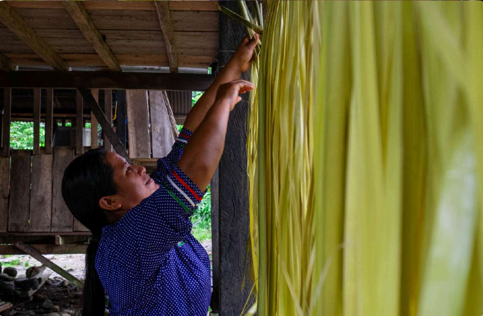
Proceso de secado de paja toquilla para elaborar artesanías.