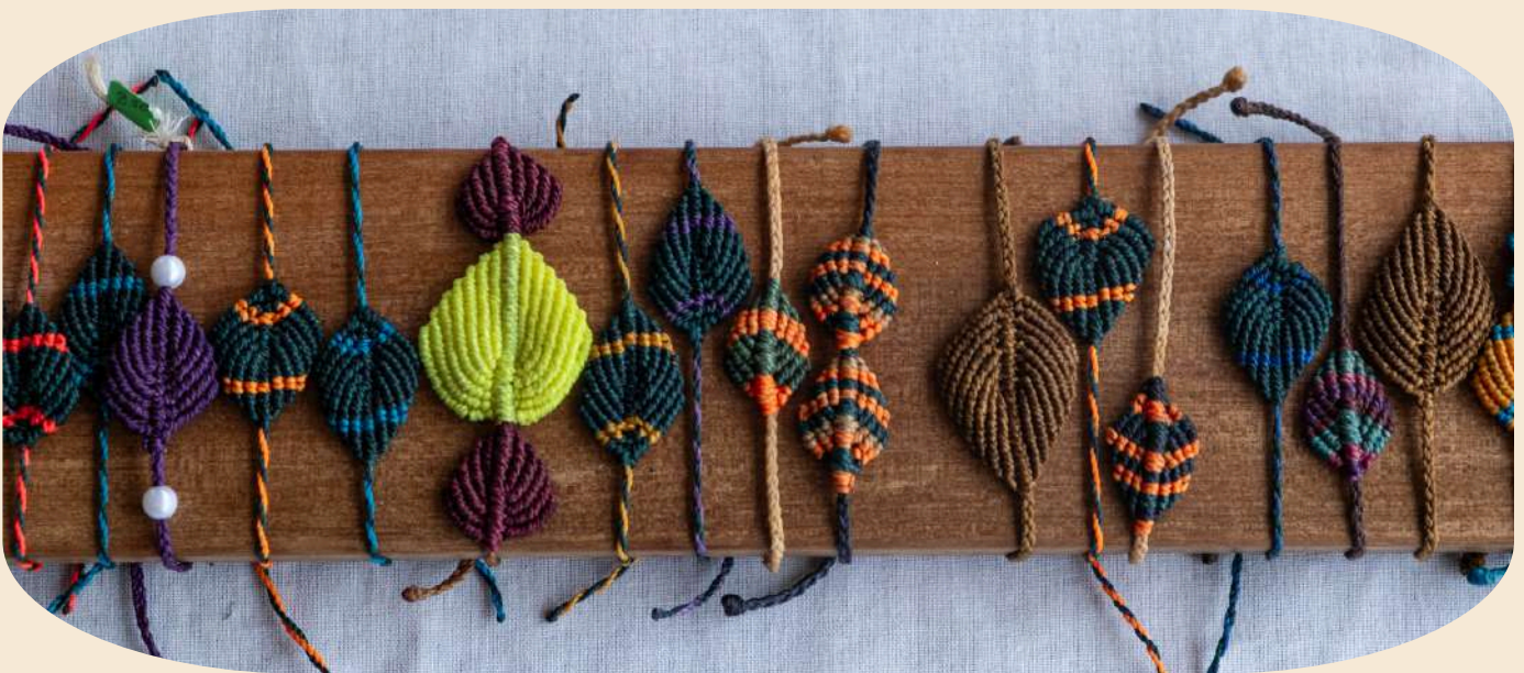
Manillas o pulseras de macramé