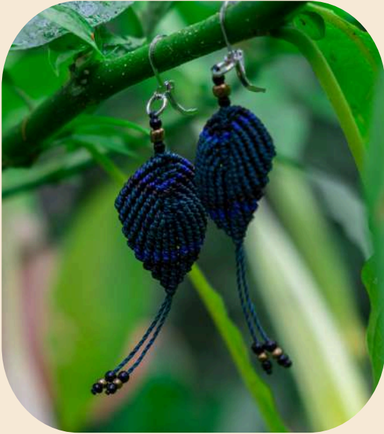
Aretes de hoja en macramé