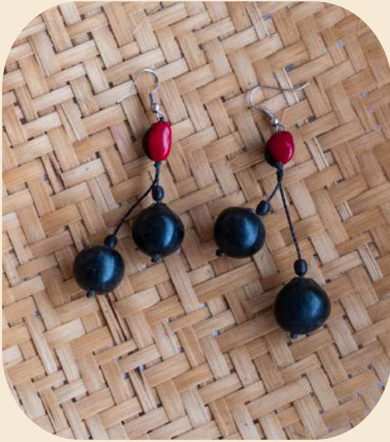
Aretes de jaboncillo y chuko