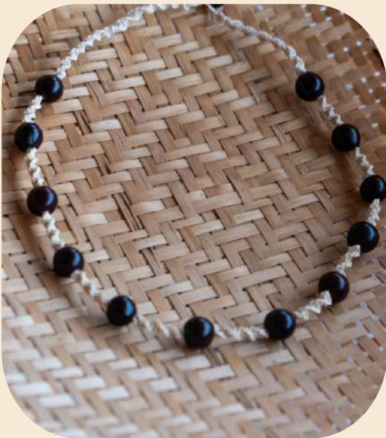
Collar de jaboncillo