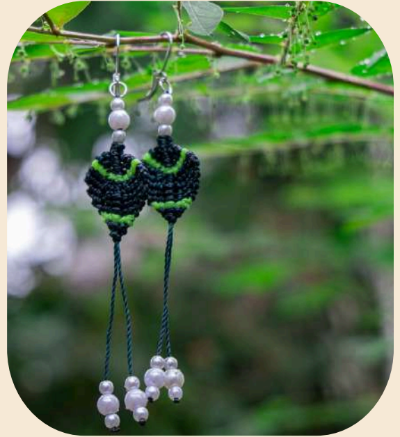
Aretes de hoja en macramé con perlas artificiales